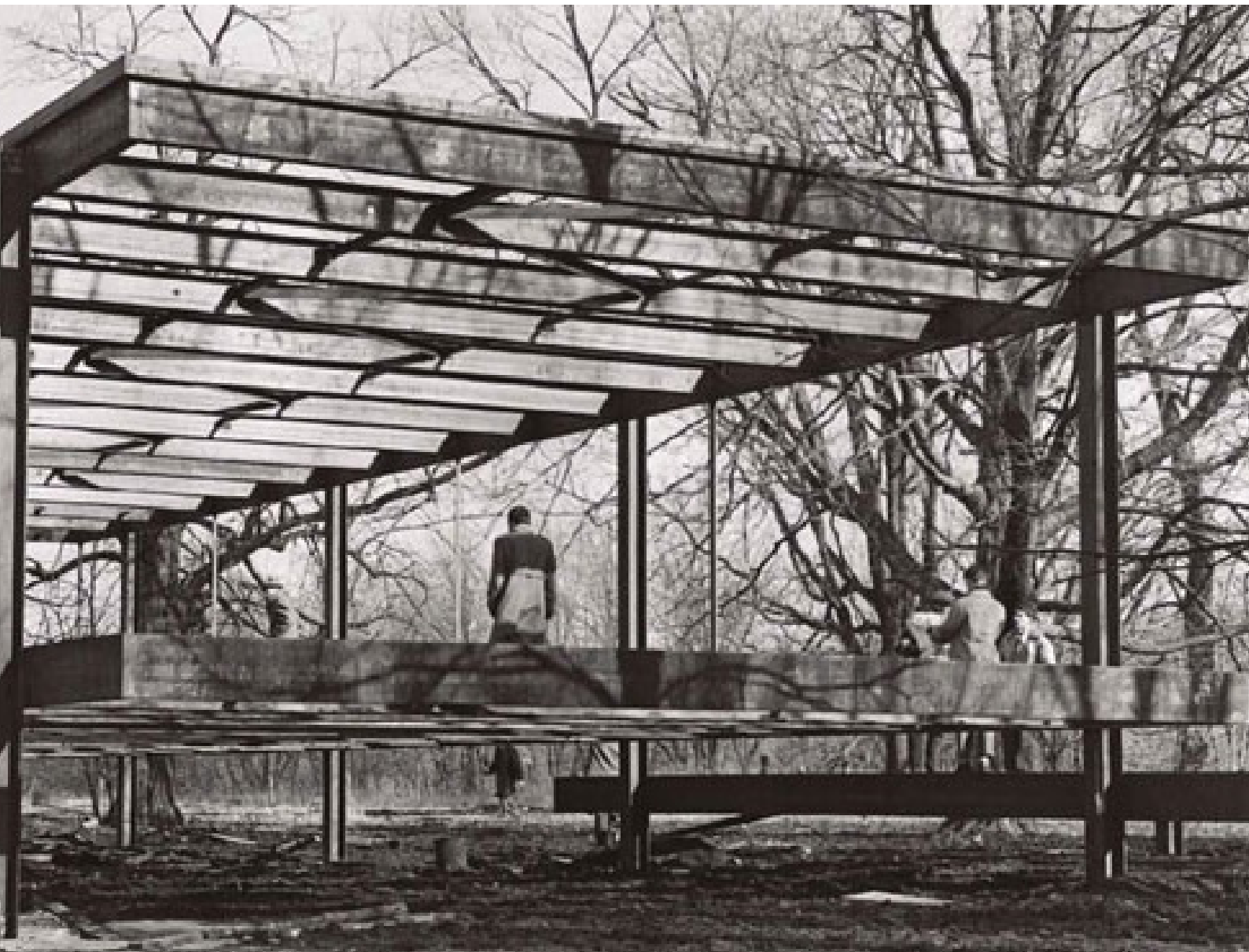
Imagen 5. Construcción de la Casa Farnsworth proyectada por Ludwig Mies van der Rohe.

Johnson se divide en cuatro segmentos temporales. Johnson aspiraba a escribir una narración biográfica a la manera de la historia del arte tradicional resultando significativamente distinto del diseño de la exposición. Asimismo, mientras Mies otorgó un lugar de honor en forma de las cuatro fotos murales a cuatro obras europeas de los años veinte (el Pabellón de Barcelona, el rascacielos de la Friedrichstrasse, el Monumento a la Revolución de Noviembre y el Rascacielos de Vidrio) en la narración de Johnson, el aconteci-