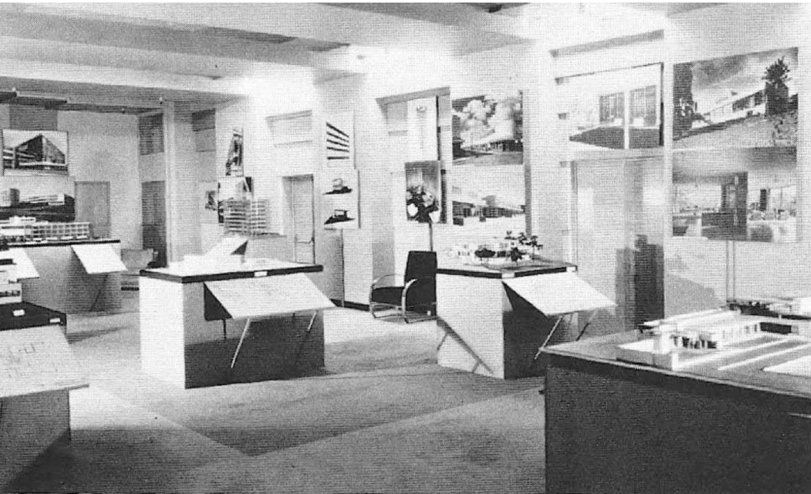
Imagen 3. Exposición Arquitectura Moderna - Exposición Internacional , MOMA, 1932.

exposición “El Estilo Internacional: arquitectura desde 1922” realizada en el 1932 en el MOMA bajo la dirección de Barr y cuidadosamente comisariada por el arquitecto Philip Johnson y el historiador de arquitectura Henry-Russell Hitchcock. Exposición que fue de gran trascendencia a la hora de mostrar la nueva arquitectura europea en Estados Unidos y que repercutió en mucha de la historiografía de la época, continuando con la política del MOMA de trasladar al contexto norteamericano las vanguardias europeas.