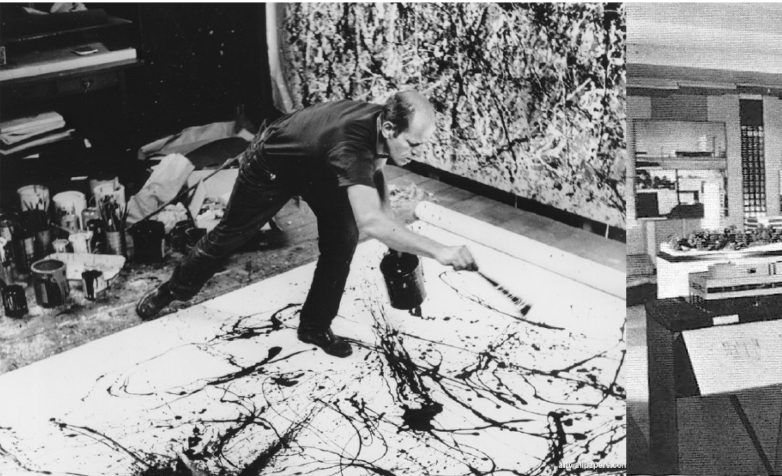
Imagen 2. Jackson Pollock realizando la técnica “Action Painting”

el arquitecto, consistió en un grupo de edificios de viviendas que resultó un muestrario de la nueva arquitectura construido por diversos arquitectos alemanes y extranjeros. Mies, a través de esta exposición generó que el Movimiento Moderno se convirtiera en un movimiento visiblemente internacional, ya que el conjunto construido por los arquitectos alemanes y los construidos por los arquitectos extranjeros –Le Corbusier, Oud, Stam, y Bourgeois– contribuyeron a evidenciar una aparente armonía de estilos del conjunto edilicio. Según Banham,