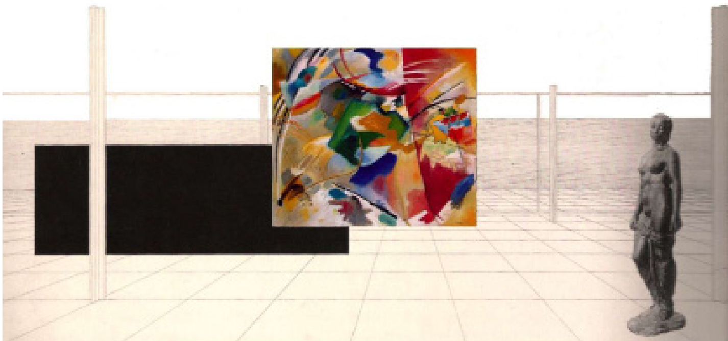
Imagen 4. Collage y dibujo de Mies Van der Rohe.